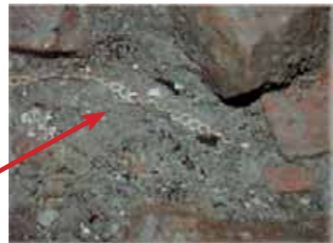
Collana in oro a maglie martellate trovata nella "pars urbana".