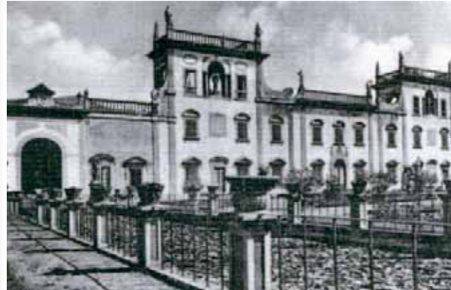
Particolare del parco di Villa Guicciardini Corsi Salviati progettato alla maniera dei giardini disegnati dal Tribolo.