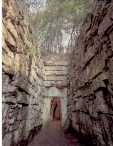
Tomba Etrusca "La Montagnola" - Dromos esterno e portale