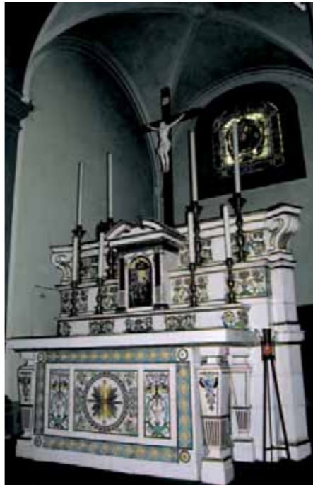
Chiesa di San Romolo a Colonnata - Altare in porcellana policroma.