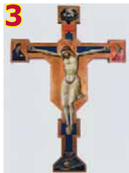
Crocifisso attribuito a Agnolo Gaddi 1390